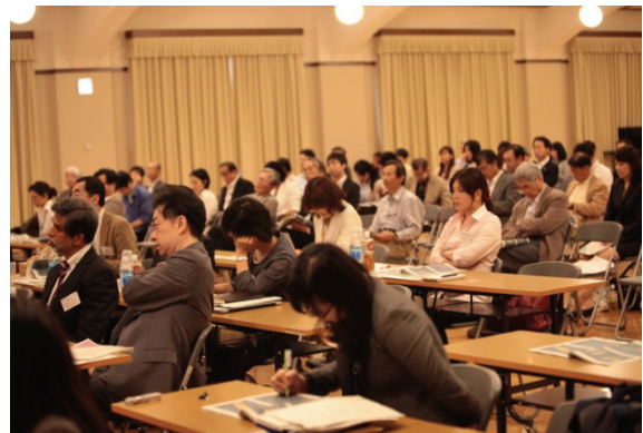
シンポジウムの様子