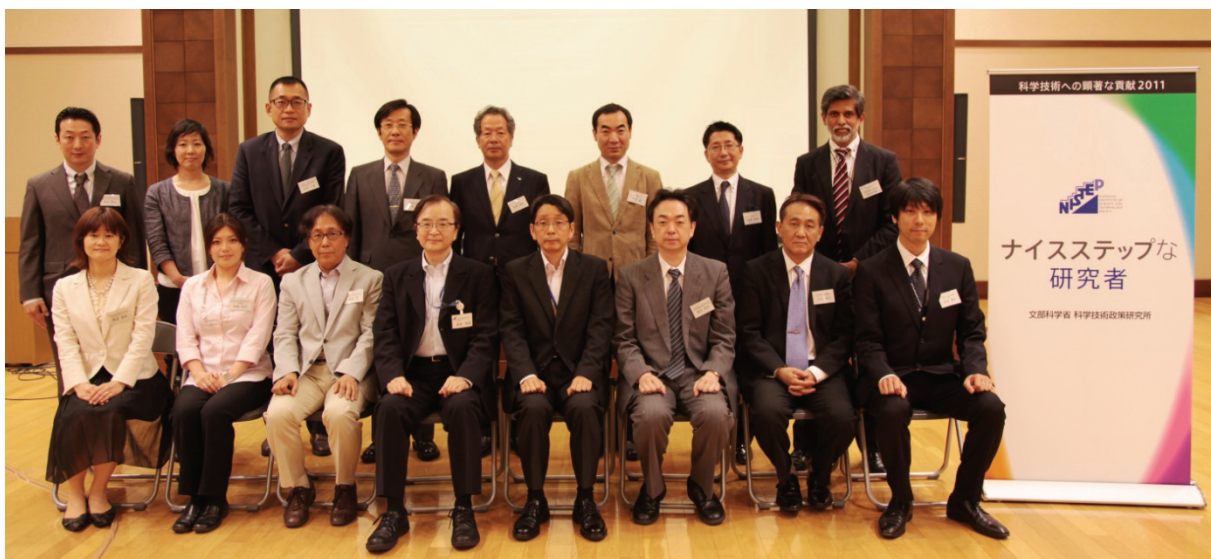
ナイスステップな研究者 2011 の皆様